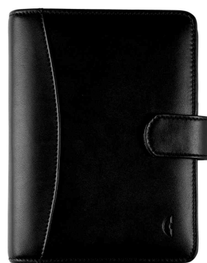
Standard Midi Compact